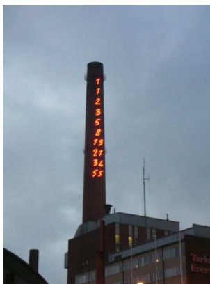
Obrázek 2: ‘Fibonacciho’ komín v Turku

Je lehké nahlédnout, že odpověď dává Fibonacciho slovo. Když označíme délky iterací F_n := |\varphi_F^n(0)| , je jasné, že počet králíků po n měsících je právě F_n . Dále snadno ověříme, že F_0 = 1 , F_1 = 2 a F_{n+1} = F_n + F_{n-1} . Není divu, že se konference věnovaná Fibonacciho slovu konala v Turku (Finsko, 2006), kde mají Fibonacciho čísla vyzdoben tovární komín.